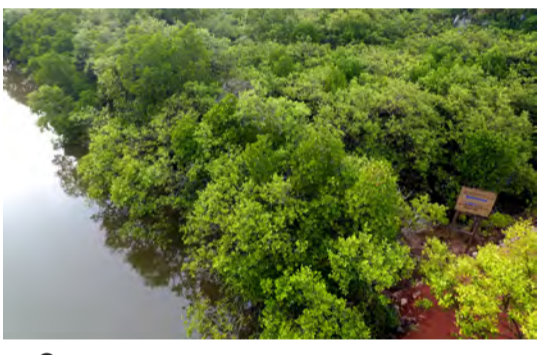
കണ്ടൽക്കാട് ഒരു ആകാശദൃശ്യം

ഭൂമിയിലെ ഏറ്റവും ജൈവസമ്പന്നമായ ആവാസവ്യവസ്ഥകളിൽ പ്രധാനപ്പെട്ടവയാണ് കണ്ടൽക്കാടുകൾ. പച്ചയും കടലും ചേരുന്നയിടങ്ങളിലെ ഉപ്പു കലർന്ന വെള്ളത്തിൽ വളരുന്ന കണ്ടൽ ചെടികൾ കടലാക്രമങ്ങളെല്ലെയും മണ്ണൊലിപ്പിനെ തടയുന്നു. സുനാമിയെ നേരിടാനും കണ്ടൽ മരങ്ങൾ പ്രാപ്തമാണ്. ഉഷ്ണമേഖലാ കാടുകൾ ആഗിരണം ചെയ്യുന്ന കാർബണിനെക്കാൾ അമ്പതിരട്ടി കാർബൺ വലിച്ചെടുക്കാനുള്ള കഴിവ് കണ്ടൽക്കാടുകൾക്കുണ്ട്.