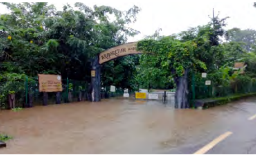
മാതൃഭൂമി ആർബറേറ്റം 2018 ലെ പ്രയത്ന സമ്മതൻ വശേഷമായി.

2017ൽ വിനോദസഞ്ചാര രംഗത്തെ മികച്ച ഇന്നോവേറ്റീവ് പ്രോജക്റ്റിനുള്ള പുസ്കാർ സമ്മാനം സർക്കാരിൽ നിന്ന് ലഭിച്ചു. കേരളത്തിന് മാതൃകയായ ഉദ്യാനമായിരുന്നു ആർബറേറ്റം.