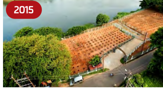
2015 മാതൃഭൂമിയുടെ കണ്ടൽക്കാട് ഉദ്യോഗസ്ഥരുടെ നേതൃത്വത്തിൽ തുടങ്ങിയവ ഇവിടെ സംരക്ഷിക്കുന്നു.

ചെയ്തു. ഈ മാതൃക തോട്ടത്തിൽ സാധാരണവും, അപൂർവ്വവും, വംശനാശഭീഷണി നേരിടുന്നതുമായ കാഴ്ചയും, പച്ചപ്പിലേക്കും വലിച്ചെടുക്കുന്ന ആകർഷകമായ സസ്യങ്ങൾ അപൂർവ്വവയനം മരങ്ങളും ചെടികളും തുടങ്ങിയവ ഇവിടെ സംരക്ഷിക്കുന്നു.