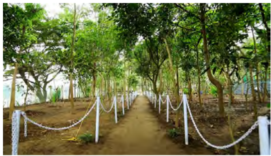
ഈ 'ഘട്ട്' ഫെഡറൽ ബാങ്കിന്റെ സഹകരണത്തോടെ നവീകരിച്ച് നക്ഷത്രവനം, രാശിവനം, നവഗ്രഹ വനം, താമരക്കുളം, വള്ളിക്കുളം തുടങ്ങിയവ ഇവിടെ സംരക്ഷിക്കുന്നു.

എറണാകുളം ജില്ലാ ഭരണകൂടത്തിന്റെയും മാതൃഭൂമിയുടെയും പങ്കാളിത്തത്തോടെയുള്ള ഒരു സവിശേഷ പദ്ധതിയാണിത്. ഈ മാതൃക തോട്ടത്തിൽ അപൂർവ്വവും, വംശനാശഭീഷണി നേരിടുന്നതുമായ സസ്യജാലങ്ങളുടെ സംരക്ഷണം അതിന്റെ ആറംവർഷത്തിലാണ്. ഏതാനും വർഷങ്ങൾക്കു മുമ്പ് മഴവിൽ റസ്റ്റോറൻ്റ് എന്നൊരു ഭക്ഷണശാലയാണിവിടെ ഉണ്ടായിരുന്നത്. നദിയുടെ ഒഴുക്കിലേക്കും കുളിരിലേക്കും പച്ചപ്പിലേക്കും കടന്നു കയറി, ജനങ്ങളുടെ