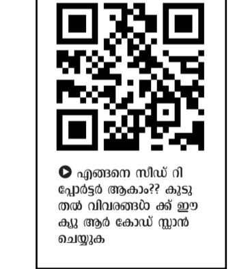
എങ്ങനെ സീഡ് റിപ്പോർട്ടർ ആകാം?? കൂടുതൽ വിവരങ്ങൾക്ക് ഈ ക്ലിക്ക് ചെയ്യുക