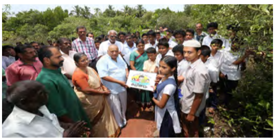
മാതൃഭൂമിയുടെ കണ്ടൽക്കാട് ഉദ്യോഗസ്ഥരുടെ നേതൃത്വത്തിൽ തുടങ്ങിയവ ഇവിടെ സംരക്ഷിക്കുന്നു.